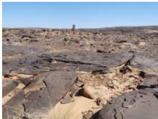
Pour la direction d'école, les débats sur la Refondation se résument à un quasi désert...

les activités périscolaires), les difficultés sont également palpables.